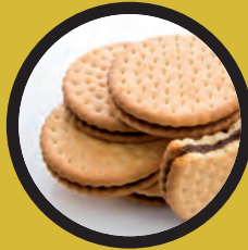
Galletas de chocolate