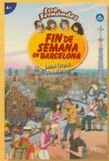
Fin de semana en Barcelona (A1+) 978-84-9778-964-6