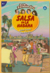
Salsa en La Habana (A1+) 978-84-9778-819-9