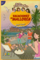
Vacaciones en Mallorca (A2) 978-84-9778-818-2