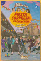
Fiesta sorpresa en Chinchón (A1) 978-84-9778-817-5