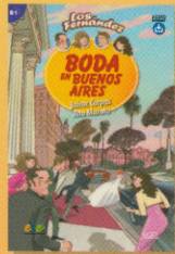
Boda en Buenos Aires (B1) 978-84-9778-820-5