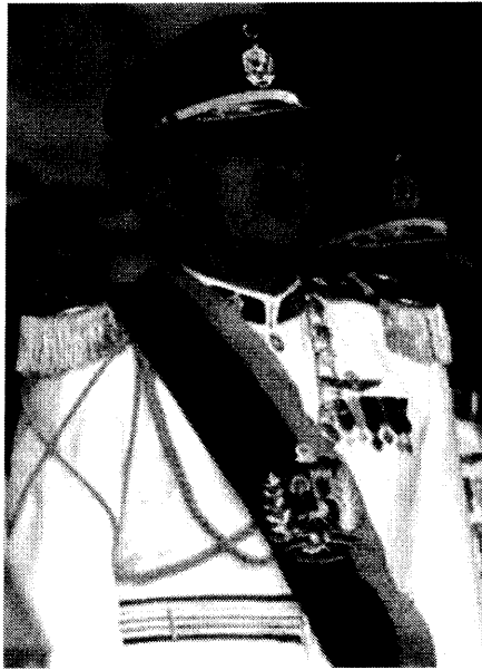
Hugo Chávez Frías

Electrónica de las Fuerzas Armadas, año 1975. Curso Medio de Blindados del Ejército, año 1979. Curso Avanzado de Blindados, año 1983. Curso de Comando y Estado Mayor, Escuela Superior del Ejército, años 1991-92. También participó en el Curso Internacional de Guerras Políticas, en Guatemala, para 1988. Cursó la Maestría en Ciencias Políticas en la Universidad Simón Bolívar, entre los años 1989-90, quedando por presentar la tesis.