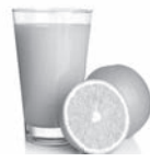
z... mo de n... ranj...