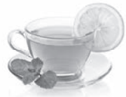
t... con l... món