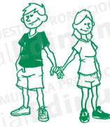
Me cogió la mano.

Me expresa la persona que posee el objeto directo: la mano .