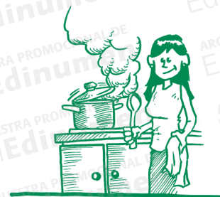
Mi madre prepara la comida.

Predicado es la parte de la oración que dice algo del sujeto. El predicado puede estar formado por una palabra o grupo de palabras: