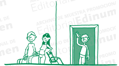
Les dije adiós a mis hermanos.

El pronombre Les se refiere a mis hermanos .