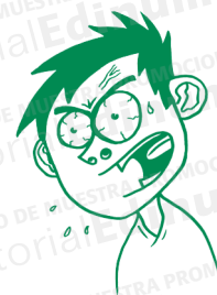
Mi amigo está enfadado.

El atributo enfadado sirve para indicar la situación o estado del sujeto Mi amigo .