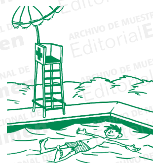
El chico se baña en la piscina.