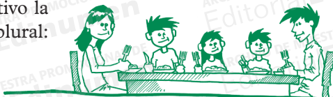
La familia son/es cinco personas.