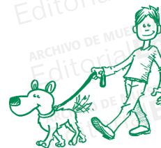
Paseo a mi perro por las noches.

Si el nombre que funciona como objeto directo es un nombre propio, la preposición a es obligatoria: