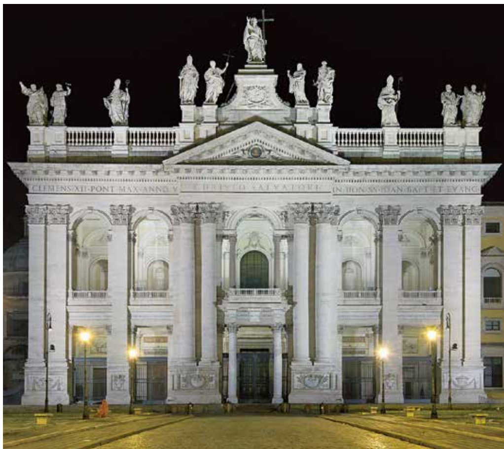
150. Fachada de San Giovanni in Laterano, Roma, de Alessandro Galilei. 1732-1736.