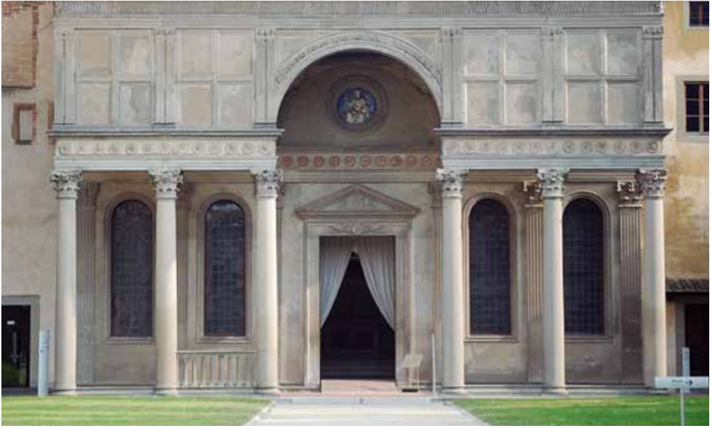
60. Pórtico de la capilla Pazzi en la basílica de Santa Croce, Florencia, a partir del proyecto de Brunelleschi. 1461.