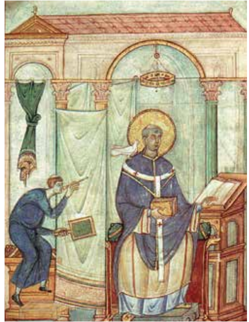
20. San Gregorio inspirado por el Espíritu Santo , en Registrum Gregorii . 963-1003. Manuscrito, 270 × 200 mm. Tréveris, Stadtbibliothek.

Basilio II 24 , encargado por este emperador bizantino (r. 976-1025) 25 . Recoge variantes de sumo interés para conocer la situación en la que se encontraban las fórmulas que venimos tratando. Se emplean bíforas y tríforas, así como la alternancia de arcos semi-circulares y en mitra, para enmarcar santos e incluso una emperatriz, y lugares sacros como el templo de Jerusalén en la Presentación . Por otro lado, la serliana a través de la influencia bizantina puede rastrearse en los mosaicos de la catedral siciliana de Monreale (década de 1180), donde se emplea a modo de puerta que sintetiza la ciudad antigua en escenas como Lot con los dos ángeles y El martirio de los santos Casto y Casio , o bien para enfatizar la majestad de Cristo en El Lavatorio –donde articula una exedra– (fig. 21) y La curación del hombre con la mano paralizada . Otros ejemplos del mismo conjunto recurren a una simplificación del motivo, situado entre torres almenadas, como La Cena de Emaús 26 .