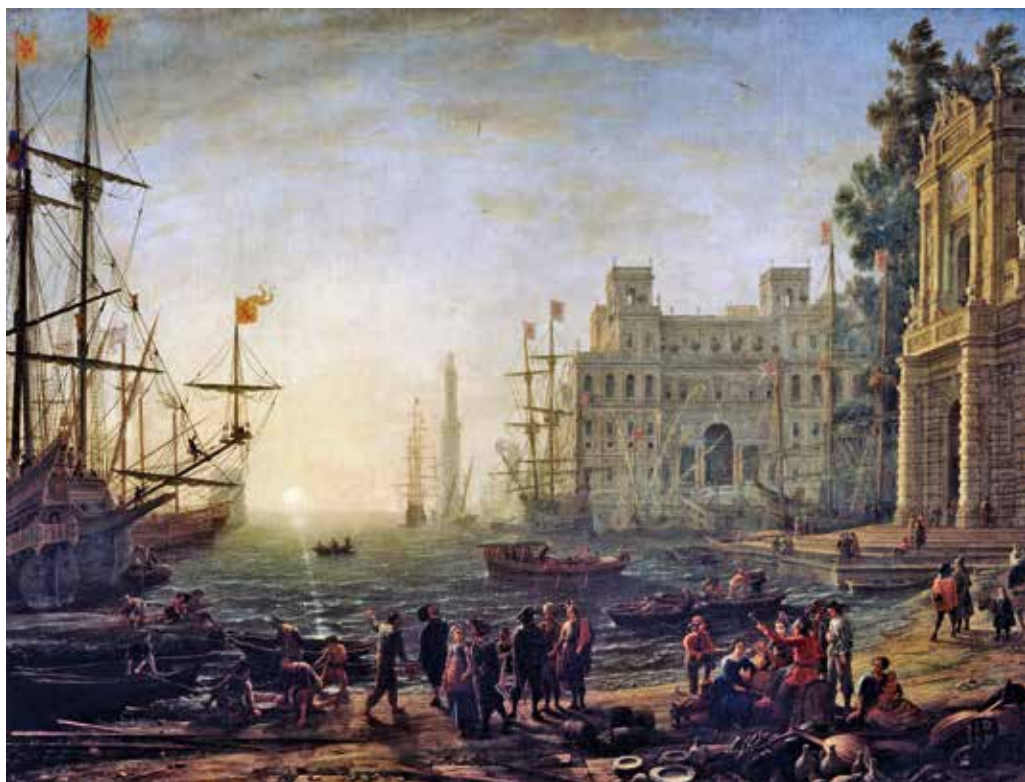
182. Claudio de Lorena, Escena de puerto con la Villa Medici . 1637. Óleo sobre lienzo, 102 × 133 cm. Florencia, Gallerie degli Uffizi.

de Viviano Codazzi y Vicente Giner 195 . En realidad, las vistas de Velázquez (1630) preceden a los trabajos de estos pintores, pues se ha demostrado sin lugar a dudas que los dos pequeños cuadros de Velázquez son resultado de su primera estancia en Italia (1629-1630), fundamentalmente por razones técnicas, pues hasta dichas fechas empleó la tierra de Sevilla, presente en los dos lienzos 196 .