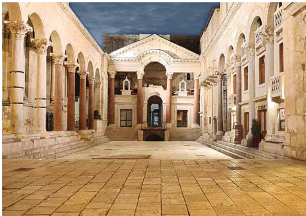
13. Peristilo del palacio de Diocleciano, Split. Siglos III-IV.

Semejante legado ofrecía importantes y prestigiosos precedentes a la Antigüedad Tardía, que se nutrió de tales modelos y cuyo lenguaje clásico se diluyó lentamente, por ejemplo sustituyendo la articulación tradicional del entablamento arcuado o las fasciae del arco por arquivoltas. La vinculación de la serliana con el ámbito militar —que existe por lo menos desde ejemplos como la espada de Tiberio— se enfatizó en el siglo IV, particularmente en el campamento de Diocleciano en Palmira y en su palacio de Split (fig. 13), resultado de una larga tradición urbanística en la que la serliana constituye el eje rector del plano; asimismo, en complejos domésticos adquirió mayor monumentalidad como fachada, si las restituciones de villas como la de Materno en Carranque son correctas. La paulatina militarización del Imperio explica el interés por magnificar estos conjuntos por medio de la serliana. La composición del disco de Teodosio (388-393) —que de nuevo une la serliana y el fastigium , e incluye en sus proximidades a Tellus para demostrar que el gobernante garantiza la bonanza del Imperio y la felicidad pública— toma el testigo de tradiciones lapidarias, toréuticas, militares y numismáticas. Esto último se debe a que se trata de un objeto simbólico con valor crematístico evidente y asimismo constituye