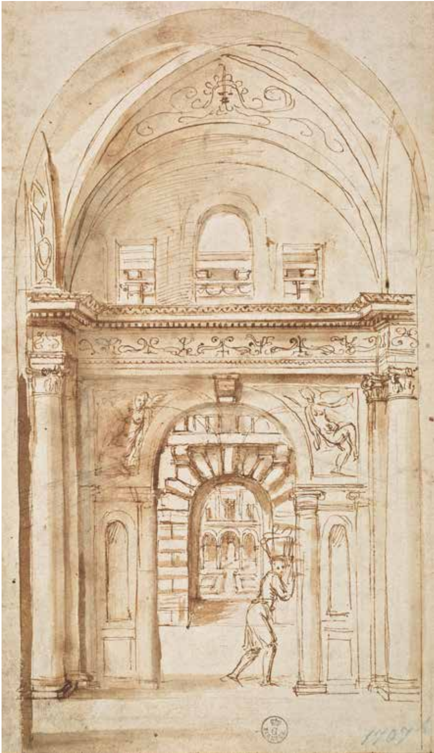
121. Giulio Romano, Proyecto para una escenografía arquitectónica . Hacia 1530. Aguada sobre papel, 722 × 566 mm. Florencia, Gallerie degli Uffizi.