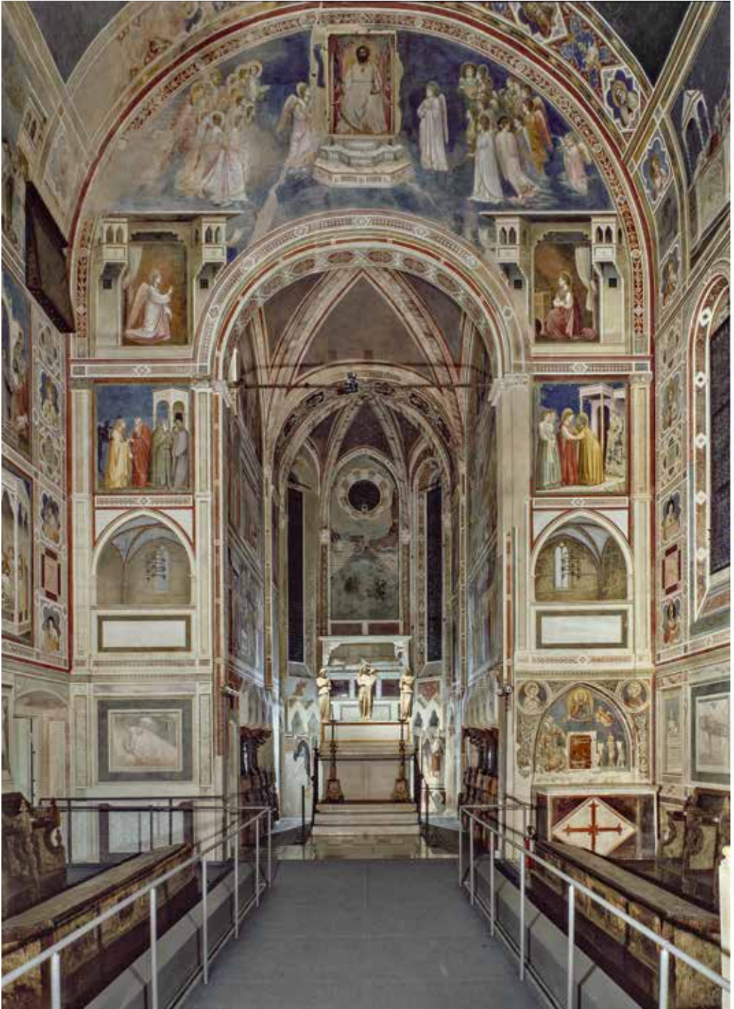
25. Giotto, frescos del Antiguo y el Nuevo Testamento. 1303-1305. Padua, capilla Scrovegni o de la Arena.