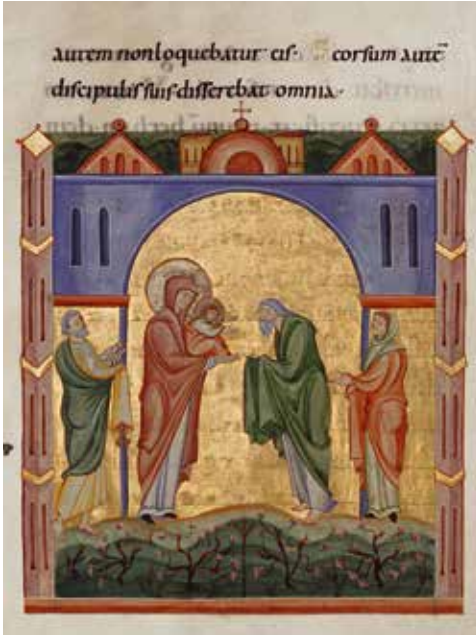
19. Presentación , en las Pericopas de Salzburgo . Hacia 1020. Manuscrito, 225 × 195 mm. Múnich, Bayerische Staatsbibliothek.