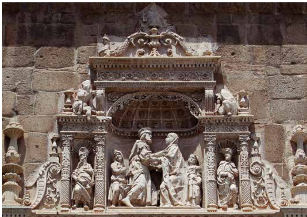
113. Detalle de la portada del Hospital de Santa Cruz, Toledo, de Alonso de Covarrubias. Siglo xvi.

La serliana de la sala de la Justicia o salón de honor podría haber enmarcado el lugar desde el que el marqués recibía a sus visitas y donde se sentaba en las grandes ocasiones, más que el «camerín de actores» que alguna vez se ha propuesto. La solemnidad del conjunto y la disposición de la sala; el hecho de que la serliana sea el vano más complejo del palacio; la importancia de dicho motivo dentro de la arquitectura italiana del momento –a nivel compositivo y como escenografía del poder: recordemos la serliana de la sala Regia del Vaticano, próxima en fechas–; y su decoración anticuaria de carácter conmemorativo y triunfal, así como el despliegue heráldico, nos obligan a reiterar que este ejemplo está vinculado a la construcción de la imagen de poder del comitente. Pero si nos hemos detenido tanto en este ejemplo de la arquitectura española es porque, en conclusión, se trata de una obra fundamental también dentro del contexto europeo, pues su solución es estrictamente contemporánea de las primeras serlianas llevadas a cabo en la arquitectura palaciega o residencial renacentista, aquellas ideadas por Bramante para la sala Regia y el ninfeo de Genazzano (véanse figs. 61-63).