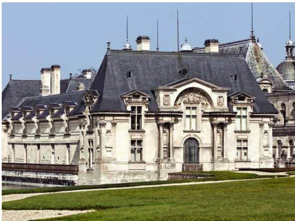
91. Petit Château de Chantilly, de Jean Bullant. Hacia 1550-1560.

soportes únicos –no dobles, como se haría finalmente– cuyo vano central cubriría con arco de medio punto, mientras que los laterales tendrían puertas sobre las que se situarían óculos ovales. Es probable que dicha composición acarreará problemas proporcionales, por lo que se optaría por suprimir los óculos y doblar las columnas. La serliana se repite en el muro de cierre y también se utilizó en los lados menores del testero, configurando un espacio rectangular rodeado de serlianas por todos sus lados, que es al mismo tiempo «mitad baldaquino, mitad arco de triunfo» 20 . En el muro de cierre del testero, en el vano central de la serliana, se situaron una chimenea y el escudo real; en los vanos laterales, las puertas que conducían a los apartamentos del rey y de la reina. Este doble papel de sala de representación y de espacio de transición entre los apartamentos masculinos y femeninos también estaba presente en la sala de la Justicia de La Calahorra, situada entre los aposentos del marqués del Cenete y los de la marquesa. El grabado de Du Cerceau muestra además una escalera que realzaba el