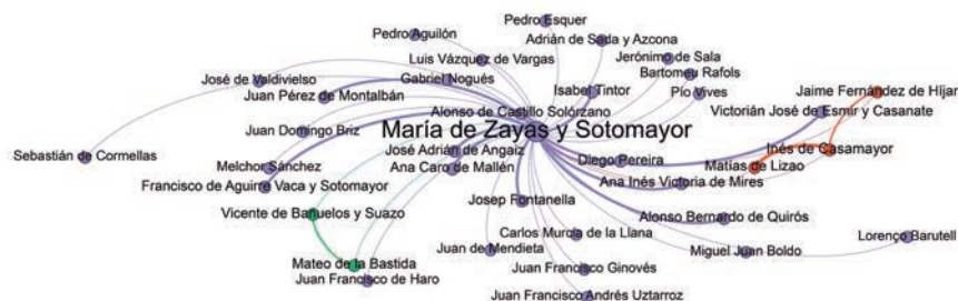
FIGURA 1 Ego Red de María de Zayas. Web de BIESES, https://www.bieses.net/maria-de-zayas-tableau/ , ISSN: 2659-2924

En nuestra propuesta lo que define el vínculo entre los actores es la relación con respecto al libro o escrito de autoría femenina, es decir, atendemos a todas las personas relacionadas con la autora en torno al libro. Forman parte, por tanto, de la red la autora y cualquier persona mencionada en los paratextos de los libros o vinculada de alguna forma a la actividad de la escritura. La red muestra y analiza a los actores por su posición dentro del tejido de vínculos, de ahí que sea esencial identificar la relación que define ese vínculo. Consideramos, entonces, que cada persona mencionada en un paratexto constituye un nodo que, al menos a través del objeto libro impreso, se relaciona con su autora, por lo que cada nodo generaría al menos un vínculo con la escritora. Los tipos de relaciones que hemos identificado tienen que ver con formas de ayuda a la escritura, formas de obstaculización, la intensidad de las relaciones o la duración de estas en el tiempo. Los tipos de relaciones más básicas proceden del vínculo de los sujetos a través del objeto