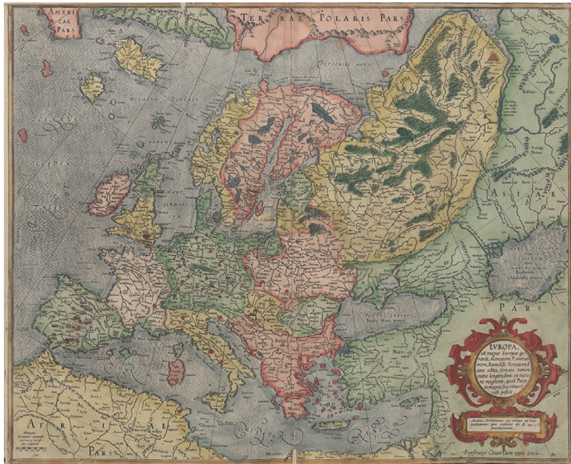
Fig. 2. Mapa de Europa . Gerardus y Rumold Mercator, 1589

Barcelona tenía solamente unos 25.000 habitantes en 1512, pero treinta años más tarde había pasado a tener 40.000. Toledo pasó a tener más de 60.000 en 1571, cifra que la colocó por delante de Granada, cuya población –como veremos– se redujo por entonces. Sevilla llegó a ser la más populosa de todas, a causa de su monopolio del comercio con las Indias; en 1561 había pasado a tener 95.000 habitantes y en 1597 contaba con más de 120.000 10 . A principios de este siglo el embajador de la república de Venecia, Andrea Navagero escribía que las ciudades más sobresalientes de España eran Sevilla, Barcelona, Valencia, Zaragoza, Toledo y Granada. A lo largo de la centuria nuestra ciudad mantendría aún cierto esplendor económico, basado en parte en la importancia de su industria sedera y de los oficios moriscos; aquella industria era tan intensiva que se decía que casi todo el pueblo vivía de ella. Además, durante este tiempo –y aún en el siglo siguiente– la ciudad se constituyó en uno de los centros culturales más notables de la Península, adquiriendo merecida fama por sus escuelas o academias artísticas y literarias. 11